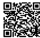
Web口座振替受付サービス申し込み