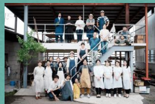
「白イチ」というイベントに出店

アウトドアショップをオープンしてから約4ヶ月が経過しました。 私の店舗が、さまざまな方の柴田町に来るためのキッカケになればと思っています。 来店された方にはどちらからご来店ですか?とお声がけをすることが多いのですが、福島県や山形県、仙台市などから来られる方が多い印象を受けます。 もちろん町内の方や仙南地域からもご来店いただいております。 一見するとなかなか入りづらい印象の建物かと思いますが、商品をご覧いただくだけでも大丈夫です。お気軽にご来店ください! アウトドア好きの方へのプレゼントにピッタリな商品もご用意しております。 ご来店お待ちしております!