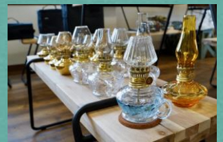
小型のランプが人気です

OUTDOORSMAN (アウトドアズマン) Tel: 080-8080-8388