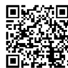
議会中継二次元コード