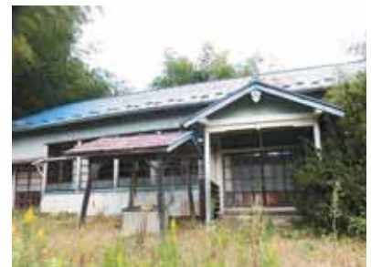
旧槻木小学校成田分校