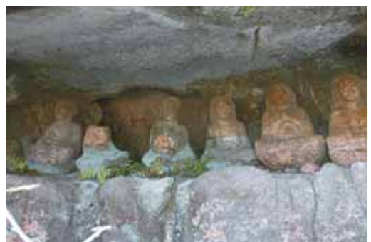
鎌倉時代からの歴史を感じます