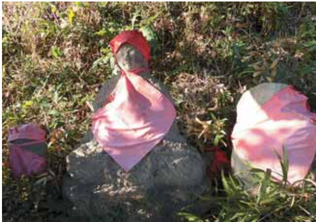
右のお地蔵さまに注目！