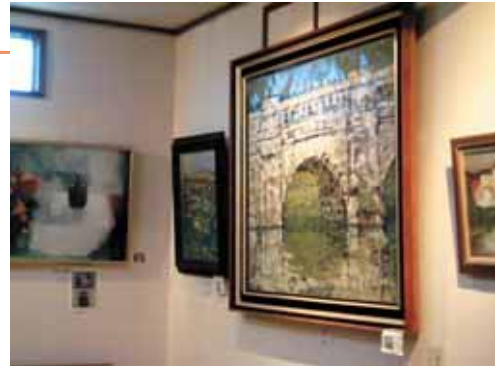
たくさんの絵が館内にあります