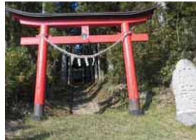
赤い鳥居と、石碑が目印！