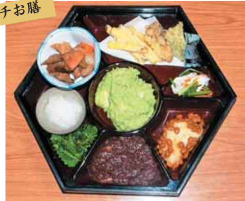
ここでしか食べられないメニューがたくさん！