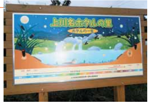
案内ボードにはホタルの見ごろが書いてあるよ