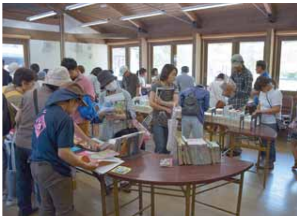
古本市は大盛況となりました。