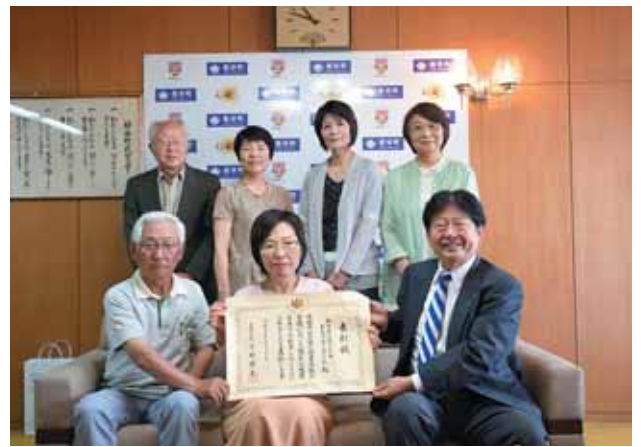
長年の活動が認められた「おむすびころりん」の皆さん

絵本読み聞かせの会「おむすびころりん」が平成27年度子ども読書活動優秀実践団体文部科学大臣表彰を受賞し、5月27日(水)に町長を訪問しました。会員の皆さんは、「これからも子どもたちに楽しい絵本との出会いの場を作り、楽しい時間を提供したい」と抱負を語ってくれました。同団体は、平成25年度の「第43回野間読書推進賞」に続く大きな受賞となります。