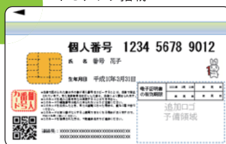
図2 個人番号カードのイメージ