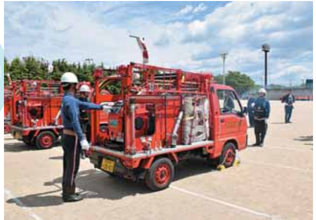
町民の生命・財産や自分の命を守る機械器具を点検