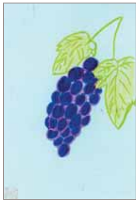
はなちゃん (ペンネーム)

smile kids お子さん(4歳まで)の 写真をお待ちしてい ます。写真の裏にお子さん の名前を必ず書いてくださ い。投稿者の住所、氏名、 電話番号、お子さんの名 前・生年月日を明記し、「ひ とこと」を添えて応募して ください。