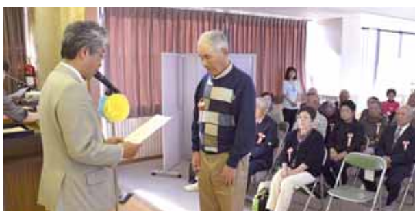
19の方が8020を達成しました。

現代社会においては、歯の健康も重要なものになっています。歯周病にかかってしまうと、口とは関係のない手術でも合併症や術後の感染症の恐れがあるため、治療してからでないことと受けられないことがあります。8020（80歳で20本の歯を残す指標）を達成できるように、家族ぐるみで口の健康予防に取り組みましょう。