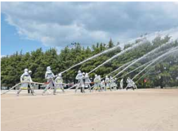
実地放水訓練を行う団員