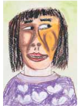
「わらってさるような顔」(絵)