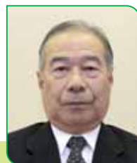
7A 区区長 平間 一彦 ヒラマ カズヒコ