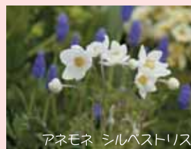
アネモネ シルベストリス

5月は“コミュニティガーデン花の丘柴田”でアネモネシルベストリス（春咲きシユウメイギク）など、たくさんの花が元気よく咲きますよ!