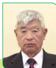
11C 区区長 吉良 一昭 キラ カズアキ