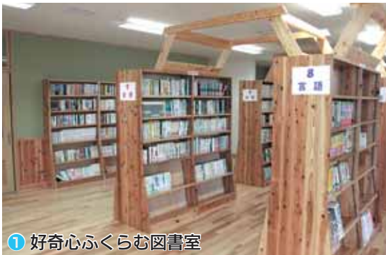
① 好奇心ふくらむ図書室

次代を担う生徒たちが、夢と希望を抱き、楽しく健やかに学習できる「学び舎」になっていくことを目指します。