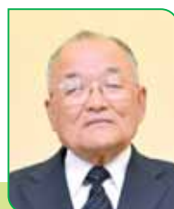
15 区区長 平間 良三郎 ヒラマ リョウサブロウ