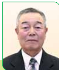
6A 区副区長 千葉 正治久 チバ マサツグ