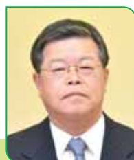
16 区区長 加藤 滋 カトウ シゲル