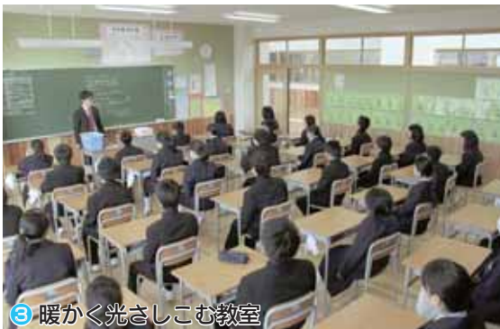
③ 暖かく光さしこむ教室