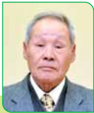
22 区区長 伊藤 政憲 イトウ マサノリ