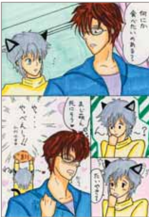
女王の番犬 (ペンネーム)