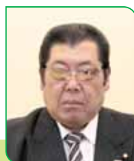
10 区区長 高橋 敏憲 タカハシ トシノリ