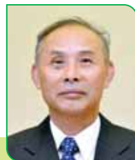
28 区区長 岩間 健一 イワマ ケンイチ