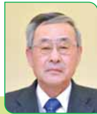
19 区区長 平間 榮雄 ヒラマ サカオ