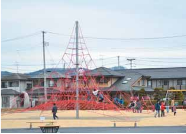
高さ9mあるザイルクライミングは一番人気です

一般公募で集まった住民のアイデアと思いを込めた公園が、船岡新栄4丁目に完成し、3月27日にセレモニーが行われました。この公園は、小さい子どもから高齢者まで楽しめる公園が特徴で、県内最大級のザイルクライミングや幼児用の遊具などが設置されています。テープカットの後、新しい遊具で遊んでいた女の子は「近くに公園ができてうれしい。今度は友達をいっぱい連れてきて遊びたい」と喜んでいました。