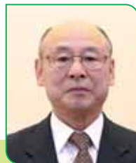
6A 区区長 澤井 義一 サワイ ヨシカズ