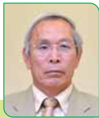
18A 区区長 岡崎 文夫 オカザキ フミオ