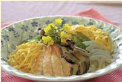
彩りちらし寿司 (4人分) 一人当たり：477kcal、塩分 1.3 g

柴田町では、平成25年3月に「第2期柴田町食育推進計画」を策定し、「食に感謝 楽しい食事はみんなの笑顔」をテーマに食育の推進に取り組んでいます。