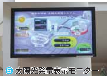
⑤ 太陽光発電表示モニター

① 落ち着きとゆとりのある図書室は、読書に親しみ学習の幅が広がります。② 屋上には、90枚の太陽光パネルが設置され環境教育に役立っています。③ 四季をとおして暖かく心地よい雰囲気のある教室は、生徒の学習意欲が高まります。④ 1階ホールは、教室から各種特別教室への移動がしやすく、のびのびとした学校生活を過ごせます。⑤ 発電量やCO 2 削減量などを表示するモニターは、環境とエネルギーを大切にすることを育みます。