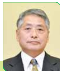
27 区区長 佐々木 功 ササキ イサオ