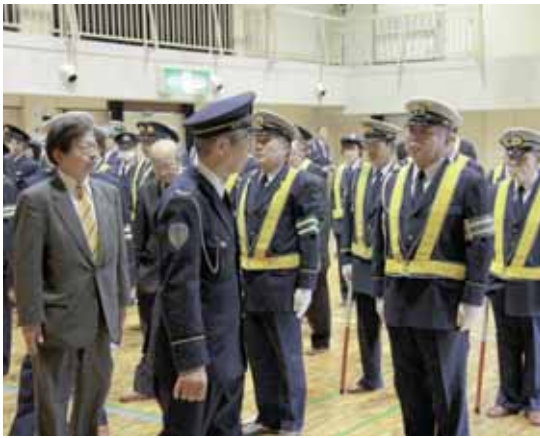
出動前の服装点検を受ける隊員たち