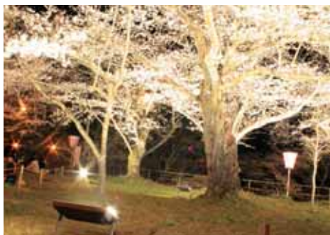
船岡城址公園ライトアップ