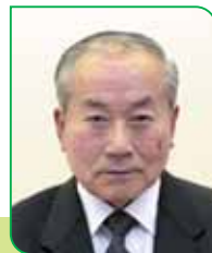
1 区区長 昆野 義明 コンノ ヨシアキ