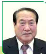
5 区区長 高橋 五郎 タカハシ ゴロウ