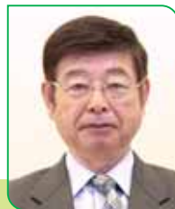
2 区区長 舟山 清一郎 フナヤマ セイイチロウ