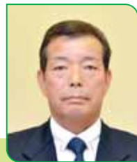
23 区区長 我妻 文男 ワカツマ フミオ