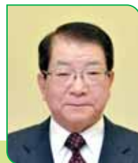
29C 区区長 滝澤 虎雄 タキザワ トラオ