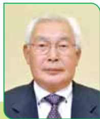
24 区区長 村上 忠庸 ムラカミ チュウヨウ