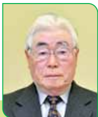
29B 区副区長 武田 英次 タケダ エイジ