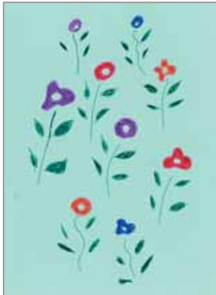
はなちゃん (ペンネーム)