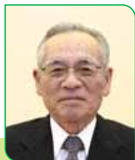
30 区副区長 齋藤 祐三 サイトウ ユウソウ