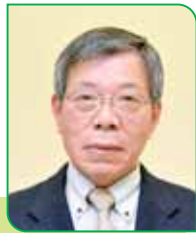
21 区区長 平間 利八郎 ヒラマ リハチロウ