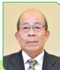
29A 区区長 菊地 光良 キクチ ミツヨシ