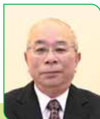
9A 区区長 中島 亮祐 ナカジマ リョウスケ