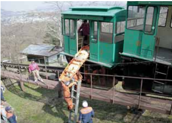
高い位置で救出活動をする消防署員

しばた桜まつり開幕前の4月5日、船岡城址公園内を運行するスロープカーの地震対応訓練が、町、柴田町観光物産協会、柴田消防署の参加により実施されました。訓練は、地震によりスロープカーが停止し乗客が中に閉じ込められたという想定のもと、通信、誘導、救出訓練が行われました。今後も、地震などの災害時に迅速、的確に初動体制がとれるよう訓練を続けていきます。