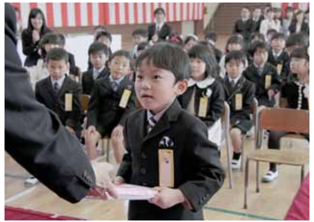
ともだちいっぱいできるかな

4月9日、町内6つの小学校で入学式が行われました。68人が入学した船迫小学校では、期待に胸をふくらませた新入生が保護者や先生の大きな拍手の中、堂々と入場し、校長先生から「お友達をたくさんつくって、楽しく勉強してください」とお祝いの言葉をいただきました。担任の先生から一人ひとり名前を呼ばれると、大きな声で「はいっ！」と答え、ドキドキ、わくわく、夢いっぱい学校の生活がスタートしました。