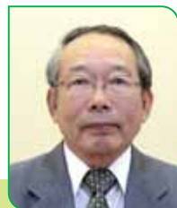
29D 区区長 笠松 亮 カサマツ リョウ