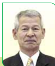
11A 区区長 大槻 文悟 オオツキ フンゴ