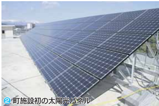
② 町施設初の太陽光パネル