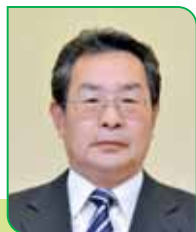
29A 区副区長 板橋 啓一 イタバシ ケイイチ