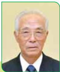
26 区区長 加茂 長頼 カモ ナゴユキ