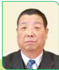
20 区区長 青野 正幸 セイノ マサユキ