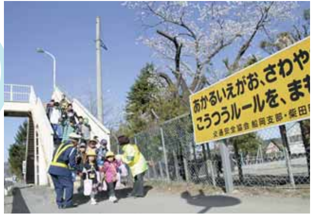
交通安全を呼びかける交通指導隊と母の会のみなさん