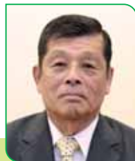
3 区区長 戸次 省三 ハツギ ショウソウ