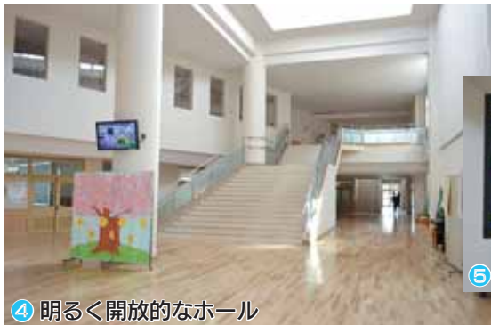
④ 明るく開放的なホール