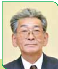
25 区区長 平間 信一 ヒラマ シンイチ