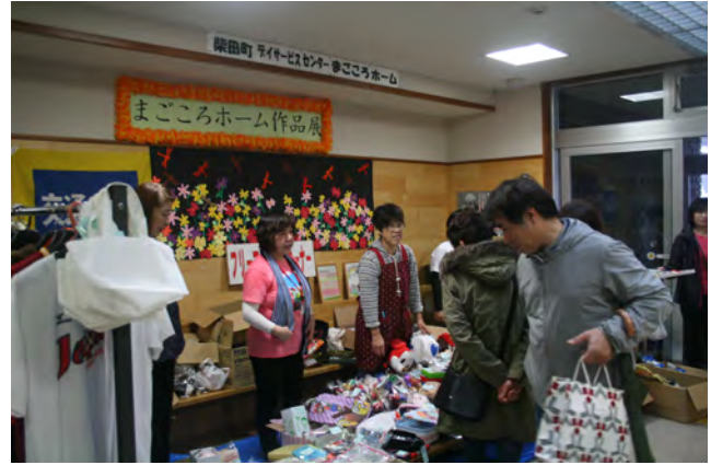
福祉まつり開催時の様子