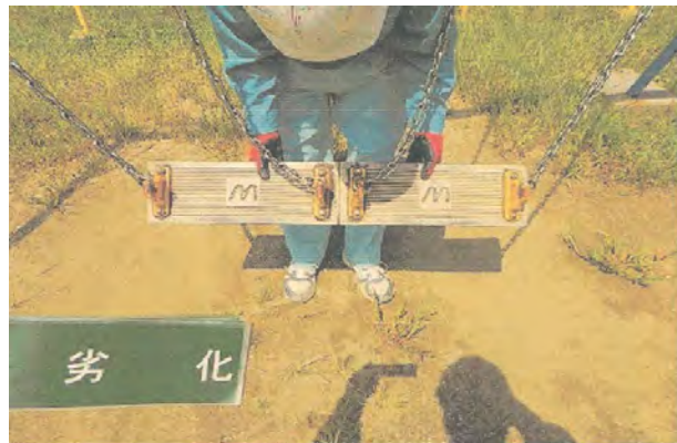
公園の遊具劣化修繕整備

公園遊具更新工事等を行い、安全安心して楽しめる公園の遊具を新たに設置したり、修繕等を行っています。また、歴史資源周辺整備も行います。