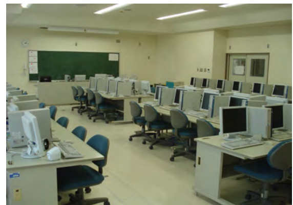
ICT教育推進のため、小中学校の電子教材、パソコン等の整備