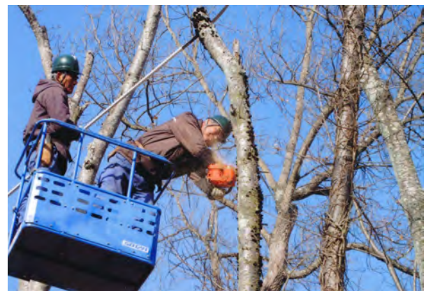
桜樹管理（桜の天狗巣病駆除）