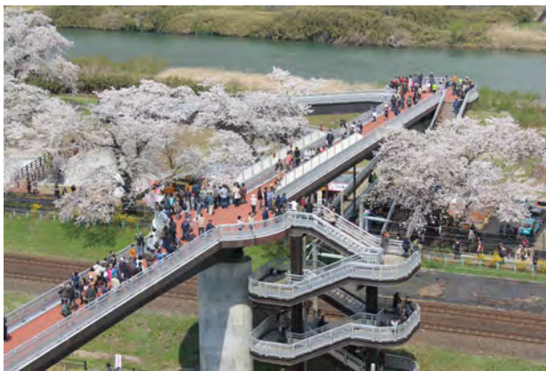
船岡城址公園と白石川堤をつなぐ「しばた千桜橋」