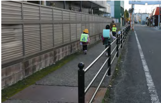
歩行者の安全確保のための交通防護柵の整備