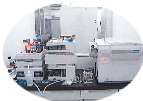
農薬類を分析する機器