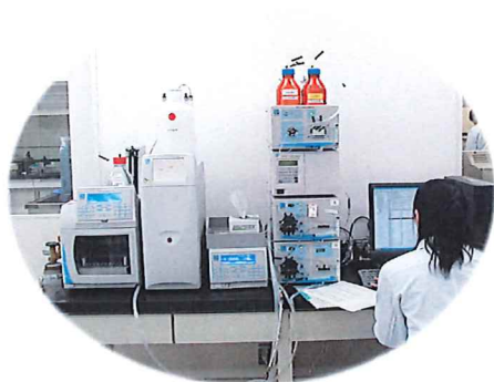
陰イオン（フッ素、塩素等） を一斉に分析する機器