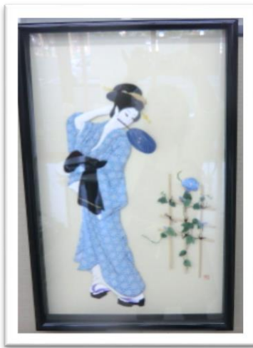
- 84歳の方が作った押し絵 -