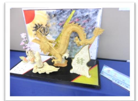
- 凍み豆腐の彫刻作品 -