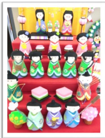
- フェルトのおひなさま -

趣味や特技の紹介、自治会、市民活動団体、NPO関係者などによるまちづくり活動紹介などさまざまな展示ができます。ただし、宗教・政治・営利に関する展示はお断りしています。