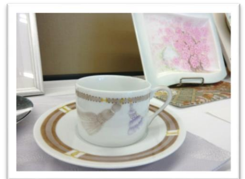
- 陶器に描かれたトールペイント -