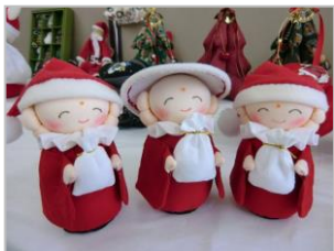
かわいいお地蔵さんや猫のサンタさん♪