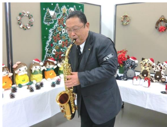
アルトサクソの音色は柔らかで艶があります

サクソというとジャズなどの洋楽のイメージですが、私の場合は「ここに幸あれ」「おふくろさん」など邦楽、歌謡曲中心です。選曲する際は、まずカラオケで実際に歌ってみて、喜びや悲しみなど曲・歌詞に込められた思いや感情を感じ取ります。そして気持ちを込めて歌う様に演奏することを心がけています。年配の方の前で演奏する機会が多いですから、聴いている方も昔を思い返しながら聴き入ってもらえているようです。