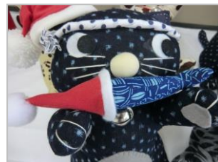
サンタ帽子付きのお魚をプレゼント？