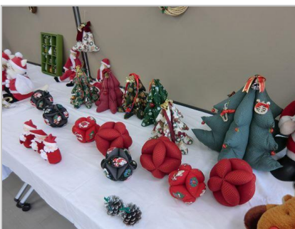
お人形以外にもクリスマスグッズがたくさん！