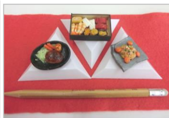
鉛筆の大きさと比べてみると本当に小さい！