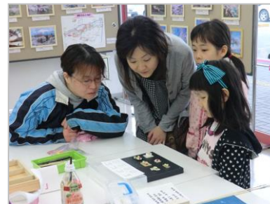
どれを作ろうかな～?? (見本をチェック中!)