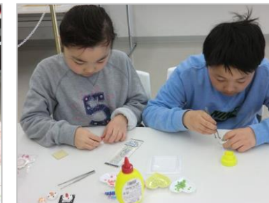
細かな作業も器用にこなしています!