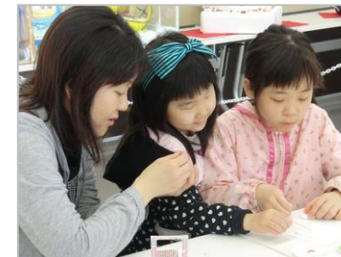
お母さんと一緒に楽しく制作中♪