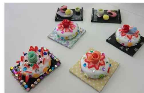
どれも美味しそうで、思わず食べてしまいそう!