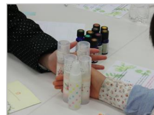
アロマスプレー集合！