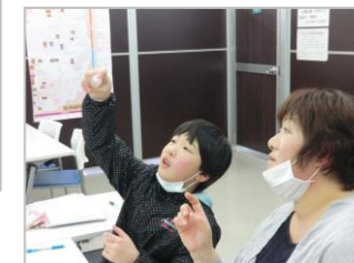
早速、出来たてのアロマスプレーの香りを楽しみました。