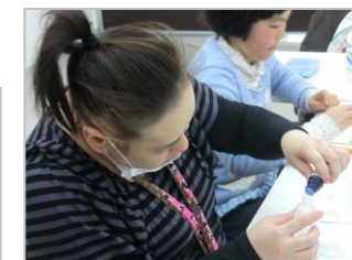
好きな香りを選んで調合中。