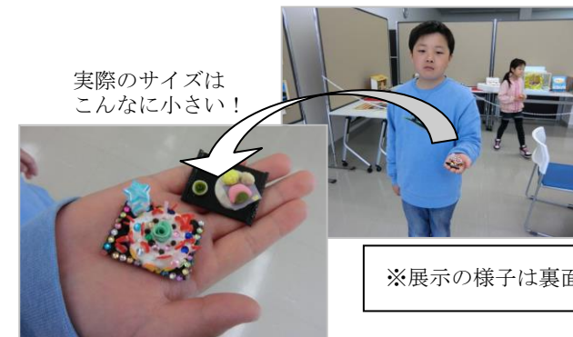
実際のサイズはこんなに小さい!