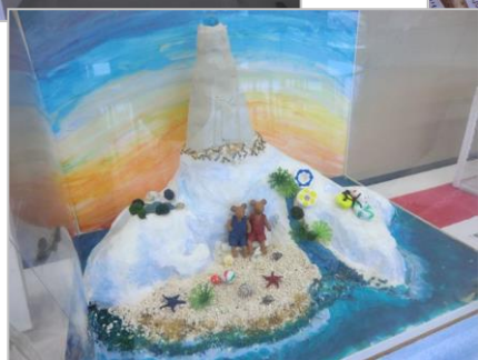
「ぐりとぐら」のジオラマ絵本を題材にした