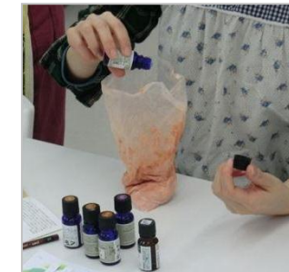
お好みの香りを選んで。