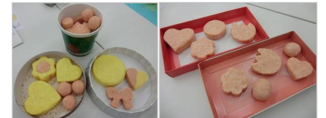
素敵な香りのかわいいせっけんが出来ました♪