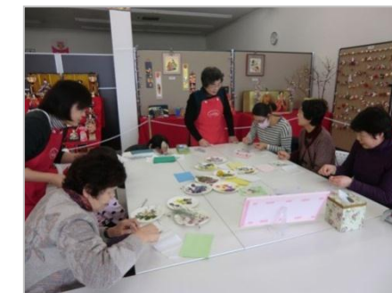
おそろいのエプロンで参加者に説明する「押し花グループ夢」の皆さん