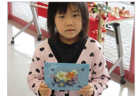
とても上手にできました♪