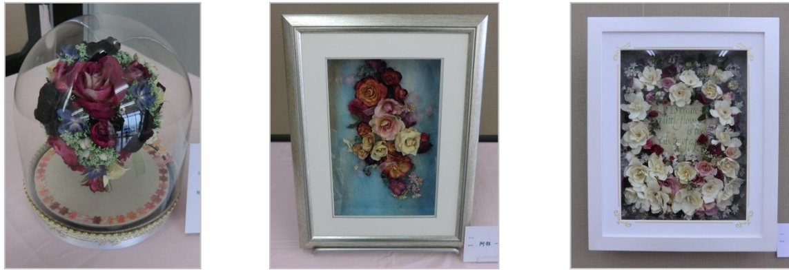
レカンとはフランス語で「宝石箱」の意味。 すてきな宝石箱をたくさん展示していただきました。