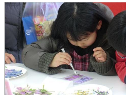
ずれないように、そっと・・・