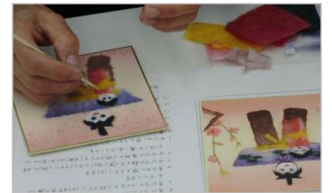
細かい作業も丁寧に仕上げます。