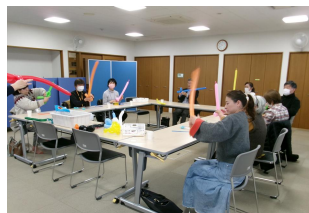
バルーンで剣と白鳥を作りました♪

年度が変わりましたので、入会申込書の内容に変更がある会員さんは、ファミサポまでご連絡ください。