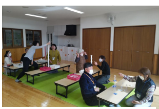
トイレットペーパーの芯を高く積んでみよう!

協力会員さんの交流の場として、情報交換や手作りおもちゃを作ります。皆さんで楽しい時間を過ごしましょう(^-^♪(申し込みは不要です) 次回は7/7です。8月はお休みです。