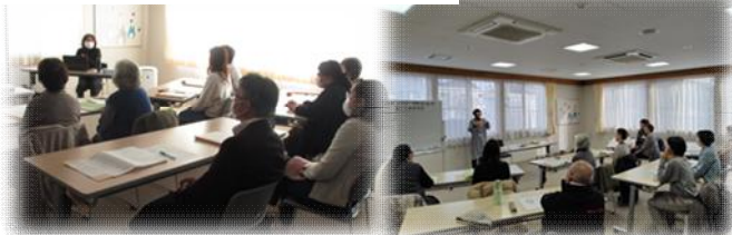
子どもの生活へのケアと援助 子育て支援サービスを提供するために