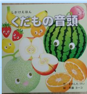
「くだもの音頭」 作 きのした けい 絵 斉藤 ヨーコ