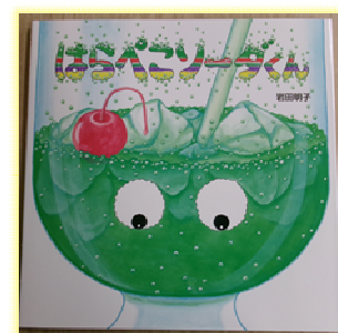
「はらぺこソーダくん」 岩田 明子

こどもはおうちの方の声を聞くことが大好きです。ページをめくったり、絵を見たり、親子で絵本を開くひとときを楽しんでみてくださいね。