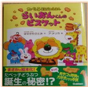
「らいおんくんの ビスケット」 作 はせがわ さとみ 絵 ア・メリカ