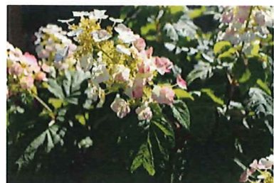
カシワバアジサイハーモニー