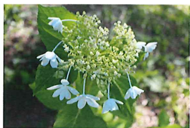
ウェディングドレス