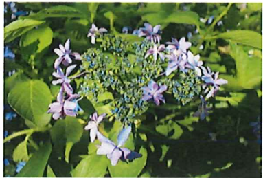
ダンスパーティー