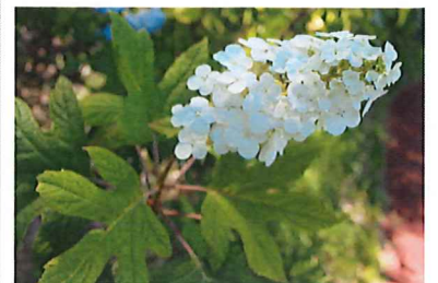
カシワバアジサイ