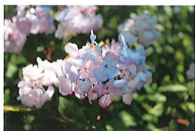
西洋アジサイ (ピンク)