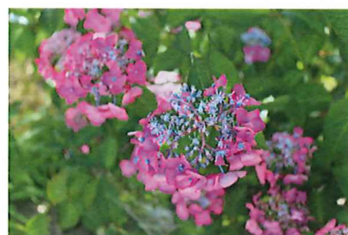
アジアンビューティー