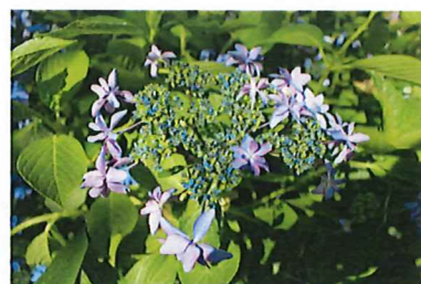
ダンスパーティー