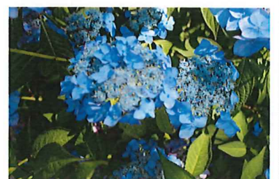
アジアンビューティー (青)