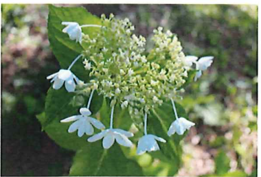
ウェディングドレス