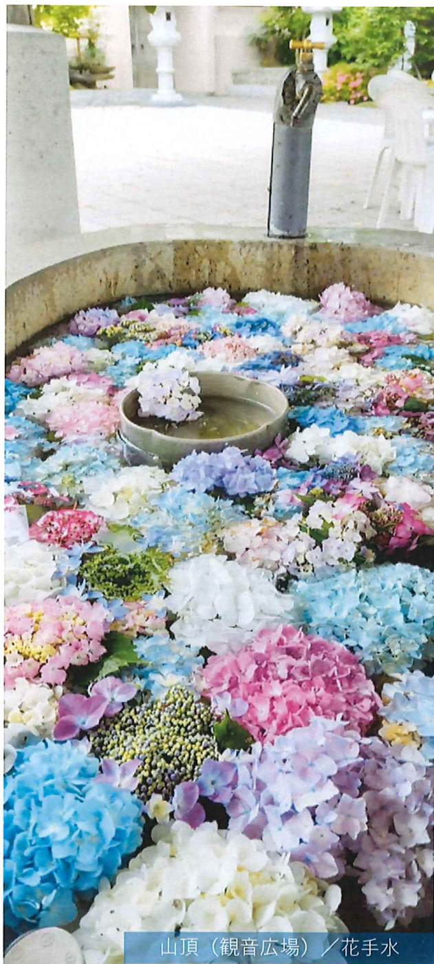
山頂（観音広場）／花手水