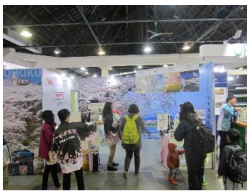
海外でのプロモーション

また、平成29年には県南4市9町（白石市、角田市、蔵王町、七ヶ宿町、大河原町、村田町、柴田町、川崎町、丸森町に岩沼市、名取市、亘理町、山元町を加えた4市9町）におけるインバウンド観光を軸とした観光地域づくりを目的とした宮城インバウンドDMO推進協議会を設立し、「一般社団法人宮城インバウンドDMO」と連携した、取り組みを展開しています。