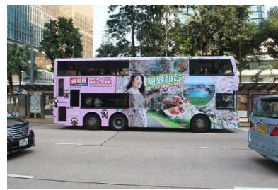
みやぎ蔵王のラッピングバス運行