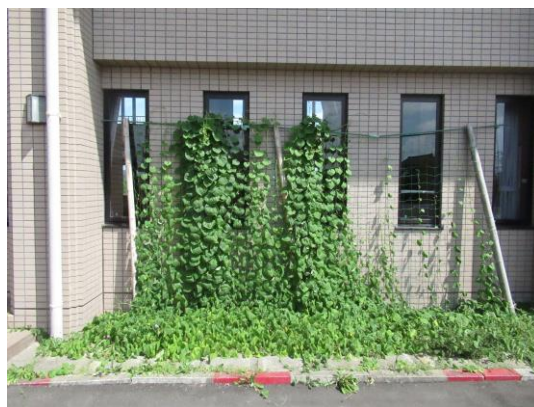
ホール西側グリーンカーテン