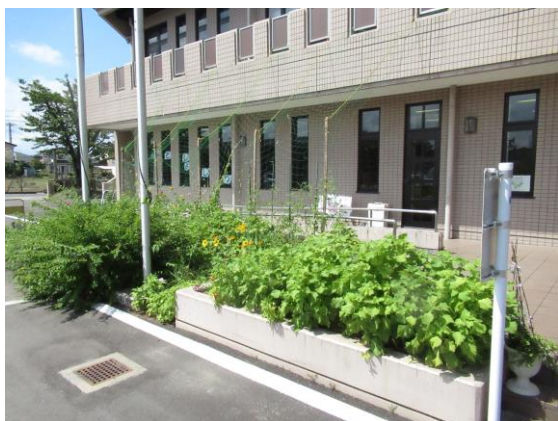
事務室前のグリーンカーテン・しそ