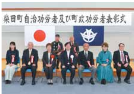
令和3・4年度 議員礼遇者、自治功労者の皆さん。