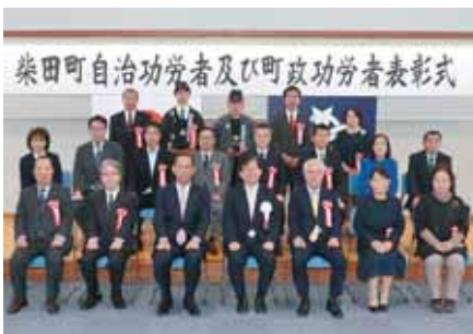
令和3年度 町政功労者の皆さん。