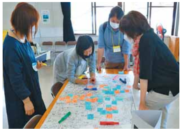
初回の講座では、柴田町の魅力について話し合いました。

6月4日(土)、しばたの発信力UP講座がスタートしました。この講座は、住民目線での町の魅力を町内外に発信するために、オリジナルの冊子の発行を目指しています。参加された方は、「皆さんと話さず自分で自分の知らない柴田町が次々出てきて、これが取材を通じてどんな冊子になるのか、とても楽しみになりました」と話してくれました。参加メンバーは、来年1月の冊子完成に向けて、取材や編集作業を進めていきます。