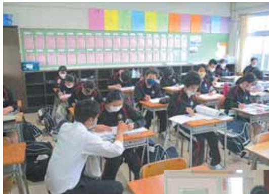
学習相談日の様子

中学生の普段の放課後は、部活動や生徒会活動などでとても忙しく、また教職員も部活動の指導などで生徒の学習相談に時間をとって対応できないのが現状でした。この学習相談日が、生徒にとっても教職員にとっても有意義な時間になるように、生徒一人一人の学びに寄り添っていきます。