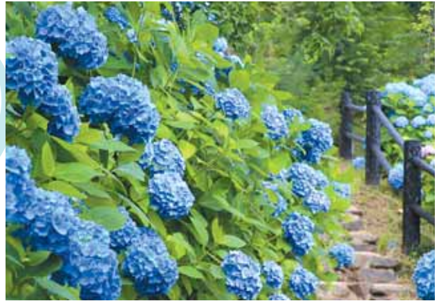
公園内にはおよそ4,200株もの紫陽花が咲いています。