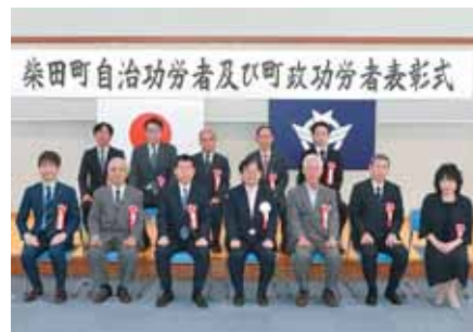
令和4年度 町政功労者の皆さん。