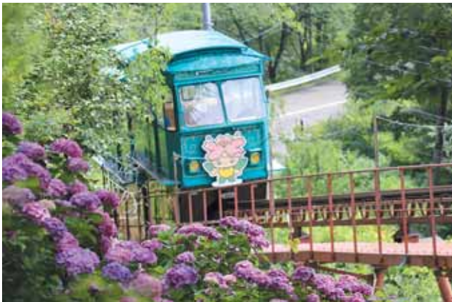
スロープカーから眺める紫陽花も見どころです。