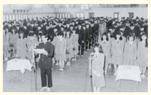
平成元年3月8日、柴田高校の卒業式が行われ、第 一期生242人がそれぞれの道へ巣立ちました。 (広報しばた平成元年4月号より)

(広報しばた昭和59年4月号より) 卒業証書が手渡されました。 卒業式。25人の卒業生に記念すべき 卒業式。19人の卒業生に記念すべき のででいる。 のででは、一切では、四位小学校(昭和59年3月19日、四位小学校(昭