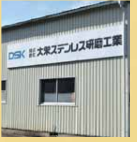
株式会社大栄ステンレス研磨工業 柴田町大字船岡字山田1-43 TEL 55-1254

昭和37年設立(東京都荒川区)。 その後、柴田町へ移転。数少な い研磨業として東北各地から依 頼を受けている 従業員6人。