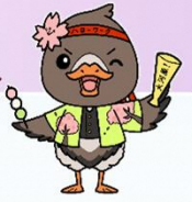
みやぎハローワークキャラクター「ガンちょーさん」