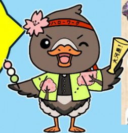
みやぎハローワークキャラクター「ガンちょーさん」