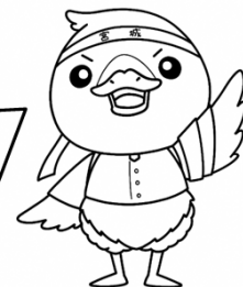
みやぎハローワークキャラクター 「ガンちよーさん」