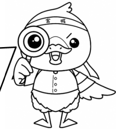
みやぎハローワークキャラクター 「ガンちよーさん」