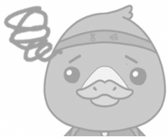
みやぎハローワークキャラクター ガンちょーさん