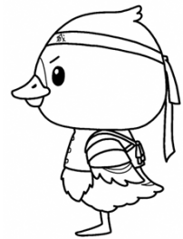
みやぎハローワークキャラクター 「ガンちょーさん」