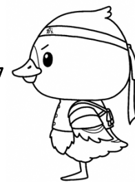
みやぎハローワークキャラクター 「ガンちょーさん」