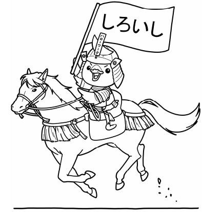
みやぎハローワークキャラクター 「ガンちょーさん」