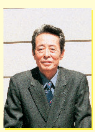
ま すみ 資産 村 (船岡東町の口)