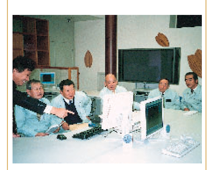
これから期待される IT 行政

等について広く町民に分 上どんな効果があるのか設の運用の仕方や、行政 域イントラネット基盤施 かりやすく周知すること た柴田町・村田町連携地 平成15年11月に竣工し