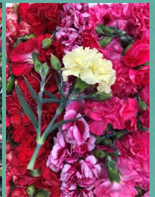
4月 花栽培の見学・野菜の種まきなど