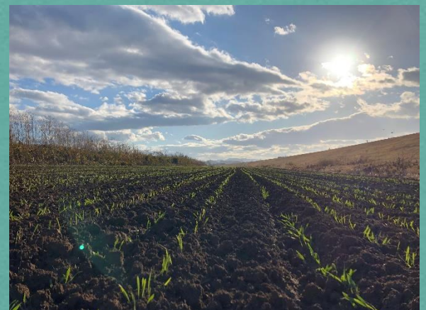
種まき後、約1ヶ月経った大麦畑