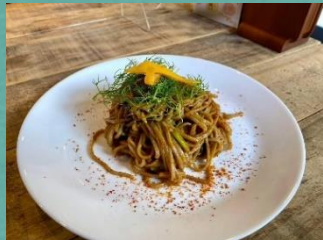
蕎麦を使ったタイ料理

これからも定期的に、蕎麦イベントやチャレンジショップなどで出店販売を行いますので、Facebookとホームページをチェックしてみてください。