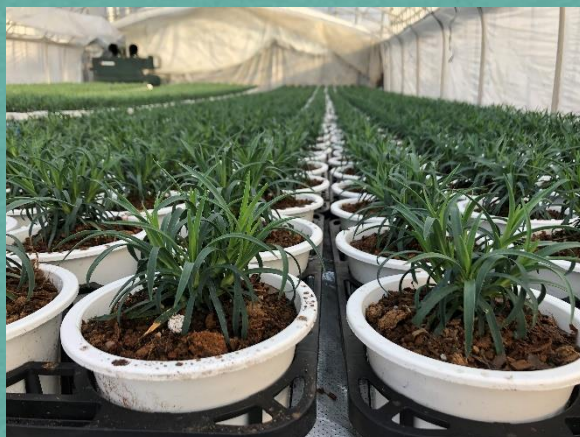
母の日に向けて成長する、カーネーション