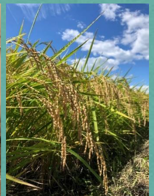
5月 田植え | 10月 稲刈り