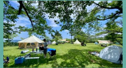
太陽の村での デイキャンプイベント