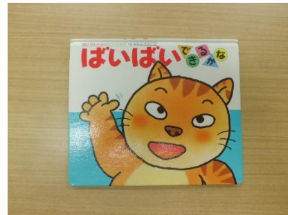
●ばいばいできるかな 作・絵 きむら ゆういち