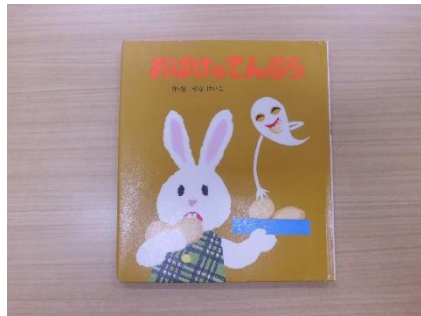
●おぼけのてんぷら 作・絵 せな けいこ