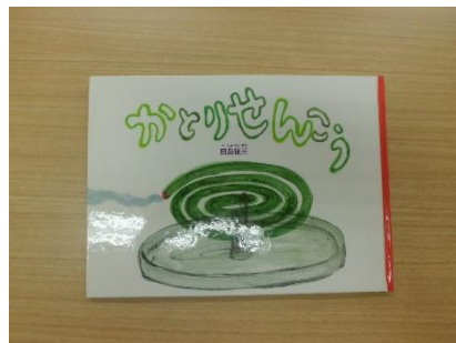
●かとりせんこう 作・絵 田島 征三