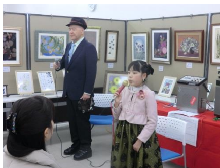
口笛コンサートの様子