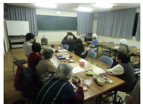
紙芝居の披露がありました。

※まちづくり提案制度は随時募集しております。詳細については、まちづくり政策課へお問い合わせください。