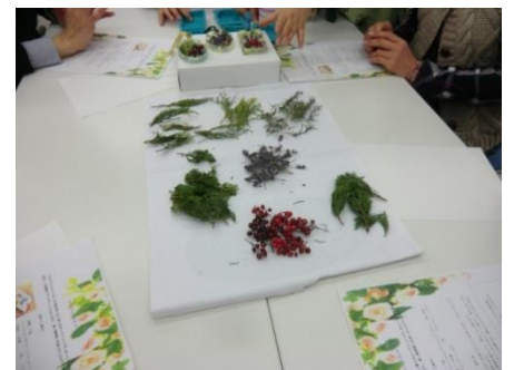
アロマワックスパー体験会様子