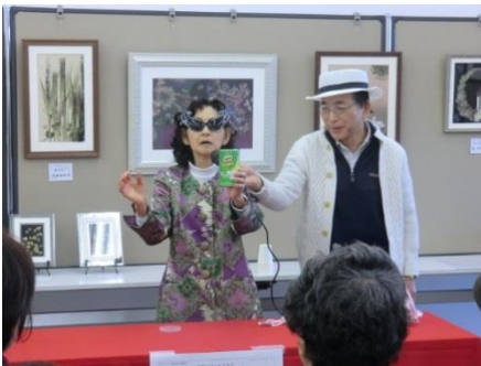
マジックショーの様子