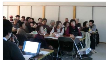
- 皆さん真剣な眼差しの受講風景 -

まちづくり出前講座の受講者52名のうち最高齢者は91歳の方でした。役場職員を講師とし、プロジェクトで映しだされる映像を観ながらの講座に、皆さん真剣な眼差しで聞き入っていました。柴田町の特殊詐欺被害は、昨年度と比較し、被害件数は同じ3件でしたが、被害額は今年度約1,180万円で昨年度より4.7倍に上っている事に皆さん驚いていました。交通安全の話では、ライトオン（早めのライト点灯）ライトアップ（目立つ装備・服装）ライトケアフル（右側注意）という「ラ・ラ・ラ運動」の詳しいお話。その後のDVDによる代表的な特殊詐欺と交通安全の観賞は、ドラマ形式で観ている方それぞれが危険なところを感じ取っている様子でした。オレオレ詐欺、架空請求詐欺、還付金詐欺等には絶対遭わないという事と、高齢者の安全運転に注意を問いかける大変有意義な講座でした。