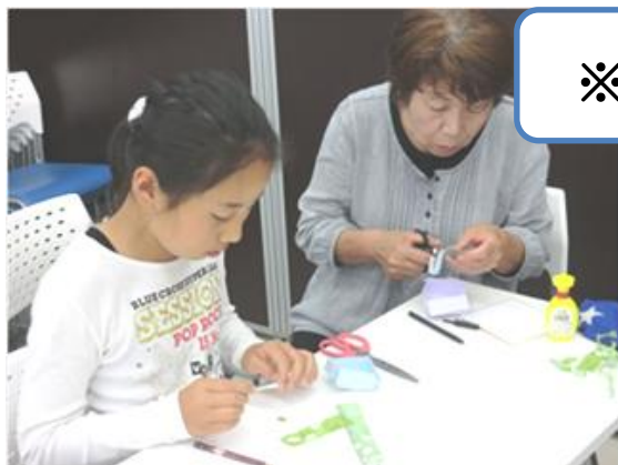
※体験会のイメージ