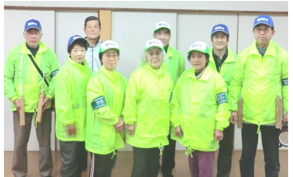
パトロール隊は昨年10月に結成