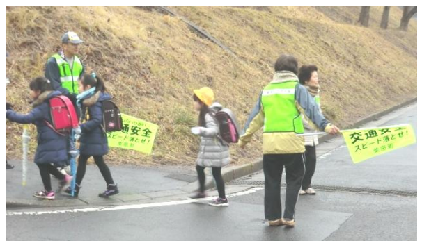
会員の皆さんの健康と地域の安心・安全向上

お彼岸にかかせない牡丹餅とお萩は、その名の通り花のイメージからです。ぼた餅は、こし餡で、おはぎは、つぶ餡で作るそうです。秋の小豆は収穫したてで皮が柔らかいので皮ごとつぶ餡とし、収穫から日が経って皮が固くなる春には、皮を取り去ってこし餡としたとも言われています。