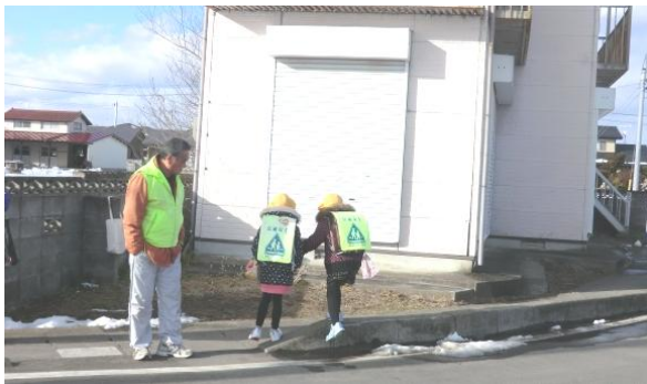
子ども達とのあいさつが元気につながります

交通量が多く道幅の狭い通学路では、子ども達に配慮して車の運転をしている方が多い中、一方では交通標識を無視する車も見受けられました。