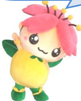
4月のギャリ-展示予告♪

アロマ体験会・ハンドマッサージ・美文字体験・消しゴムはんこづくり・和紙ちぎり絵年賀状作りなど