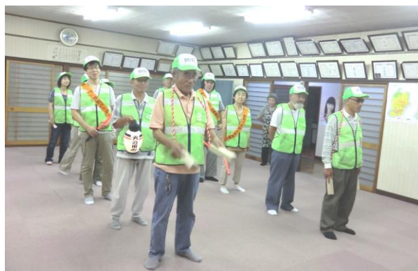
パトロールのポイントを確認し出発！

防犯パトロールは「犯罪・事故・災害の被害を未然に防止する」、「ご近所同士が顔見知りとなり連帯感が生まれる」、「地域環境の見直しのきっかけになる」等、犯罪等被害に遭いにくい環境づくりに効果があると言われていきますので、活動の長期継続が期待されます。