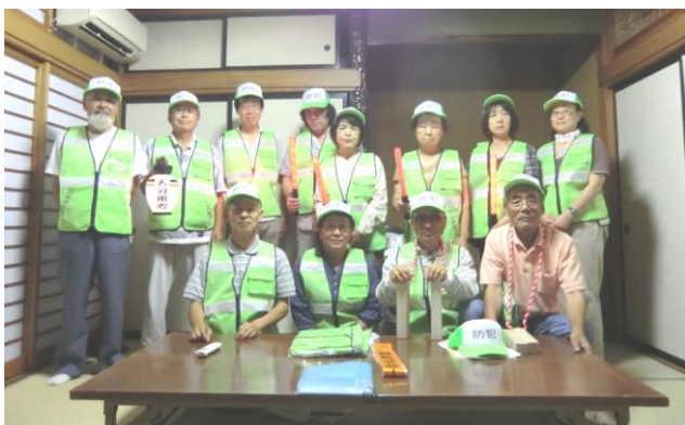
今回当番となった隊員の皆さん