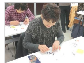
クリアファイルに貼っていきドライヤーで乾かします。