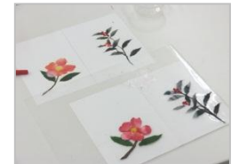
上:見本 下:受講者の力作!