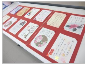
お正月らしい年賀状や羽子板の作品も素敵です。