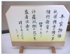
力作揃い！日頃の練習の成果ですね。