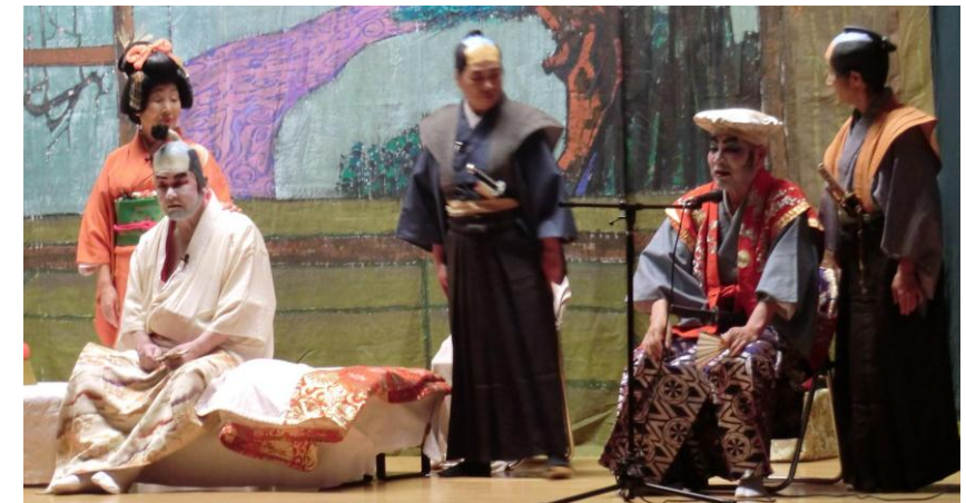
第5回唐桑地区福祉まつりでの公演の様子