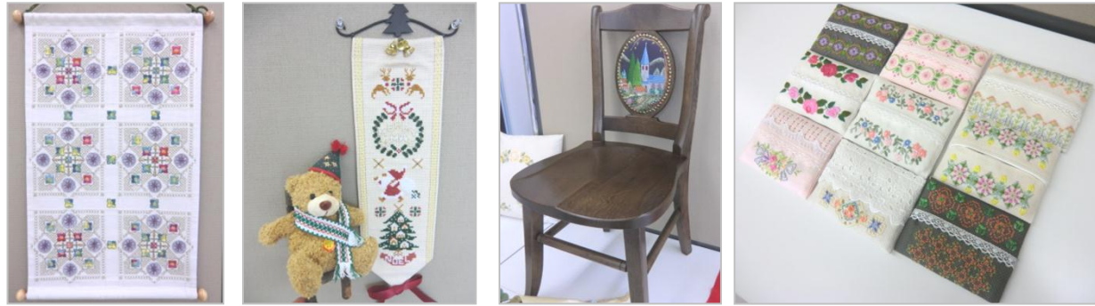
タペストリー・のれん・クッションカバー・ポーチなど、大小さまざまな作品をたくさん展示していただきました。