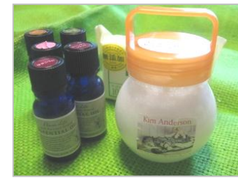
アロマクリームせっけん